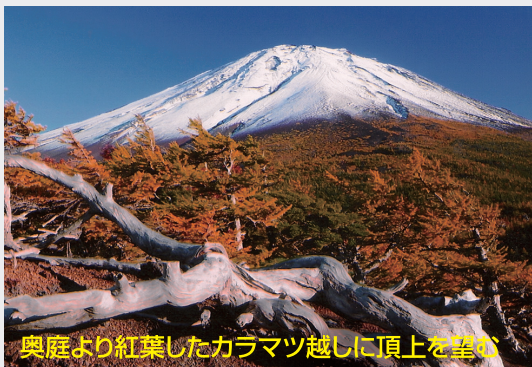
奥庭より紅葉したカラマツ越しに頂上を望む

富士スバルライン五合目の約2km手前の北側が奥庭自然公園で、散策コースが整備されています。入口には奥庭駐車場があるため、気軽に訪れることができる場所です。遊歩道の散策は一周約30分。中間点の展望台からは下界が一望でき、カラマツが黄色く紅葉する10月中旬は特に見頃です。また、コケモモ(ハマナシ)の群落もあり、春には白い花が、初秋には真っ赤な実を見ることができます。