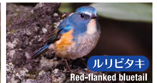
ルリビタキ Red-flanked bluetail