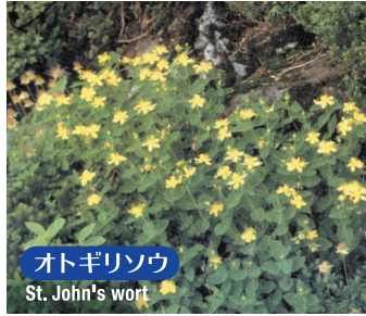
オトギリソウ St. John's wort