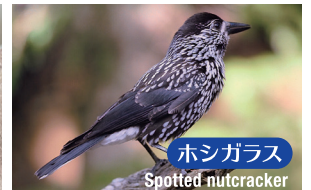
ホシガラス Spotted nutcracker