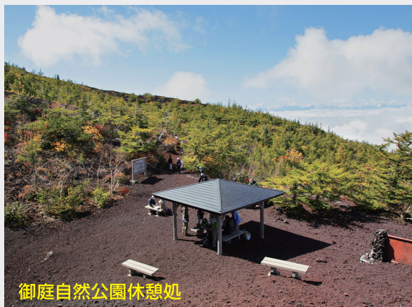
御庭自然公園休憩処

お中道を五合目から約60分歩くと、御庭自然公園に到達します。その名の通り、大自然が創った庭園で、山頂を目前に、下界の展望も抜群です。五合目より手前の奥庭駐車場を利用して登ると、徒歩15分ほどで御庭の東屋に到着できます。周辺で見られるカラマツは、盆栽のように小さい独特の樹形をしており、これは風雪が厳しい富士山ならではのものです。