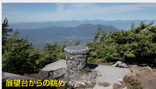
展望台からの眺め