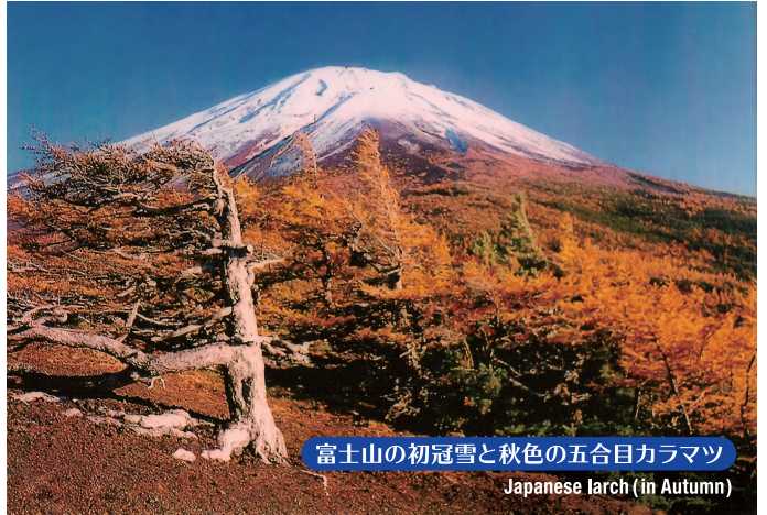
富士山の初冠雪と秋色の五合目カラマツ Japanese larch (in Autumn)

★ Removing plants or lava is prohibited. Please protect the nature of Mt. Fuji, a World Cultural Heritage Site.