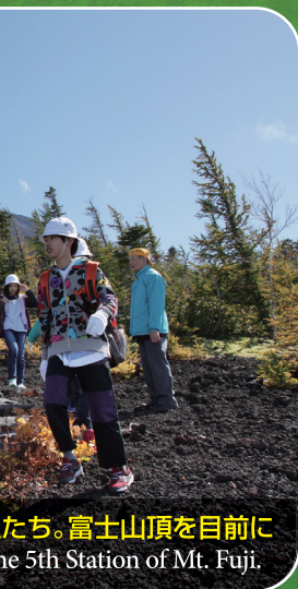
たち。富士山頂を目前に the 5th Station of Mt. Fuji.

大沢駐車場 (四合目) Osawa Parking Lot (4th Station)