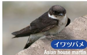
イワツバメ Asian house martin