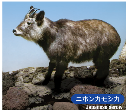
ニホンカモシカ Japanese serow

In the area around the 5th Station of Mt. Fuji, you can encounter wild animals such as serow and deer, and numerous wild birds.